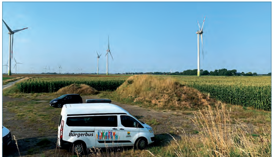
Der Markteinstieg für Erneuerbare-Energie-Gemeinschaften gestaltet sich trotz einer Vielzahl an Förder- und Organisationsmöglichkeiten aufwändig

Ende 2020 gab es 896 EG in Deutschland, jedoch fanden 2020 nur 13 Neugründungen statt. Im Vergleich wurden 2011 über 167 EG gegründet, der Trend geht also stark zurück [1]. Dies hängt maßgeblich mit den anhaltenden Novellierungen des EEG und dem Umstieg auf das Ausschreibungsmodell 2017 zusammen (siehe Abb.). Durch die dynamische Veränderung des EEG nahmen jedoch auch Unsicherheiten in Bezug auf die Investitionsrentabilität für die Realisierung neuer EE-Projekte zu. Dies gilt maßgeblich für EG, betrifft aber auch andere Rechts- und Organisationsformen, die häufig bei Bürgerenergieprojekten Anwendung finden, so z.B. bei Gesellschaften mit be-